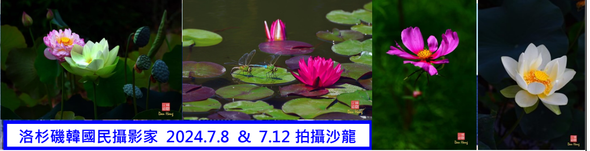
洛杉磯韓國民攝影家 2024.7.8 & 7.12 拍攝沙龍